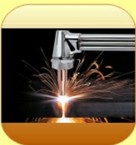
Industrie und Instandhaltung